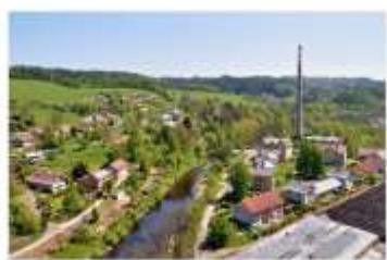
Kotelna Obec Semily