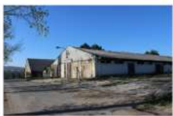
Historický statek Obec Raspenava